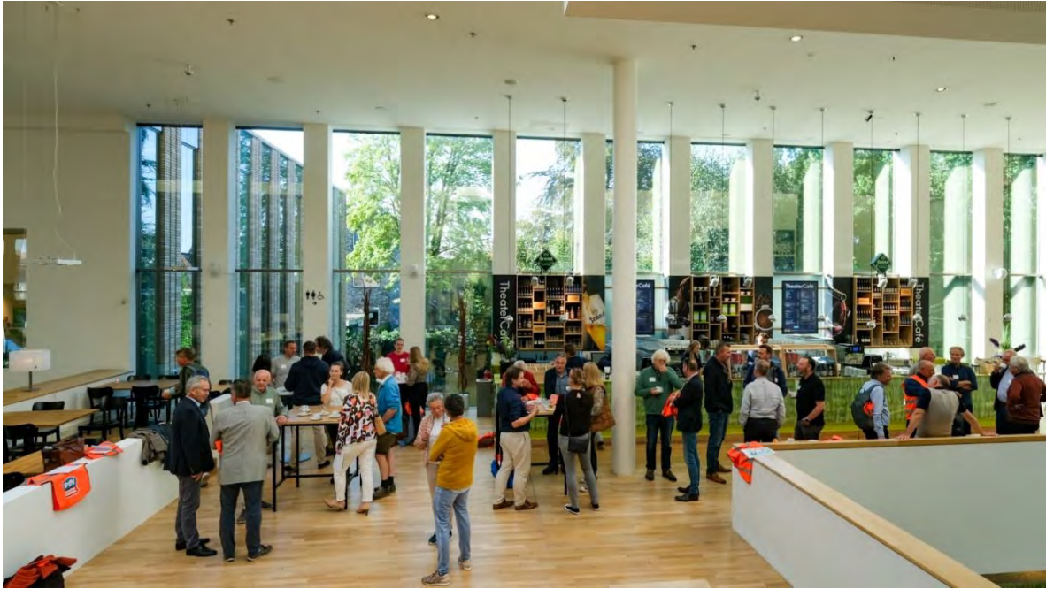
Ontvangst in DNK Assen