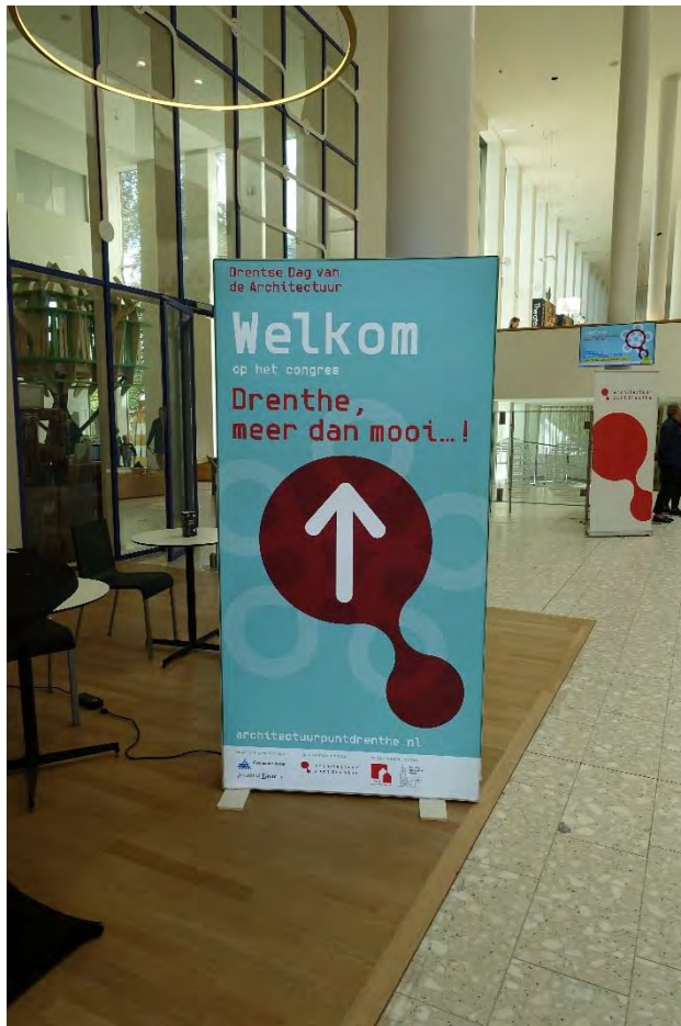
Ontvangst in DNK Assen

Na terugkomst werd de groep verwelkomd voor een lunch.