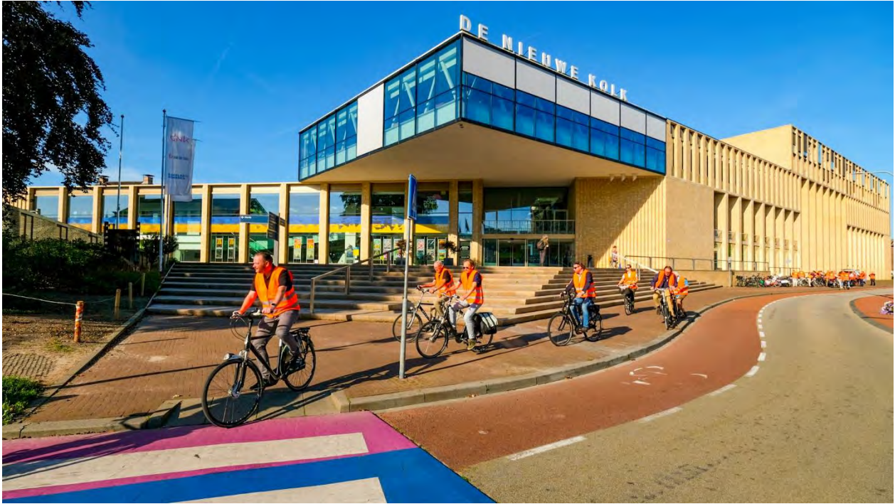
Vertrek bij De Nieuwe Kolk 'op fietse'